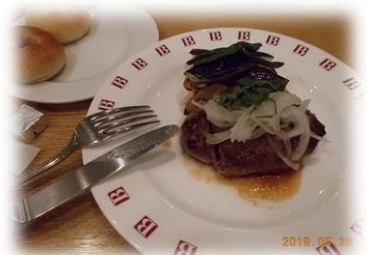
発寒イオンショッピングとランチ