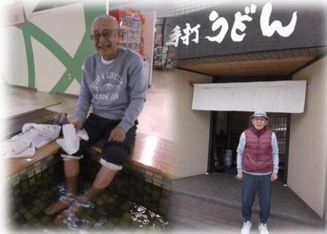
足湯と手打ちうどん