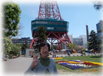
大通り公園散策とランチ